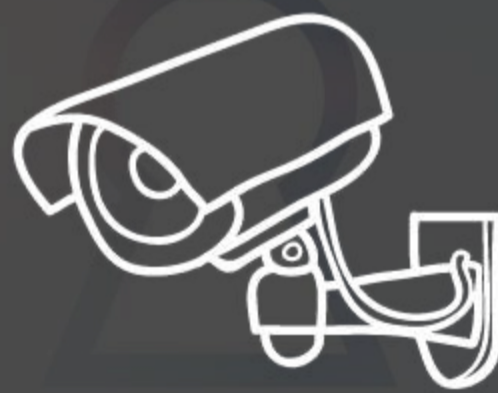
EQUIPO DE LA MEJOR CALIDAD