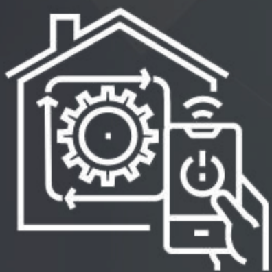
APLICACIÓN CON PANEL DE CONTROL