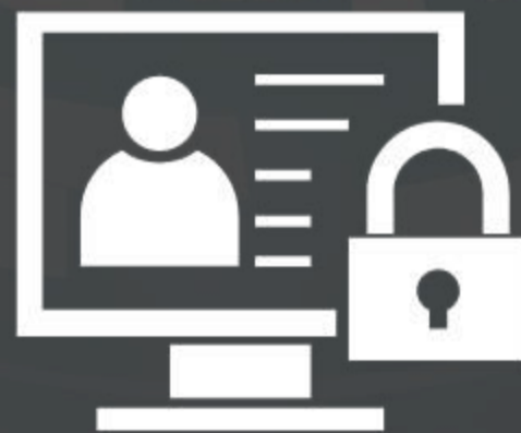
PRIVACIDAD DE TODA LA DATA